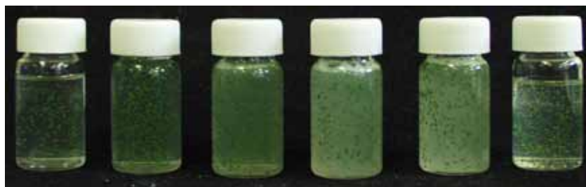
SLES-2EO SLES-2EO: CAB (9:1) SLES-2EO: CAB (8.5:1.5) SLES-2EO: CAB (8:2) SLES-2EO: CAB (7:3) CAB